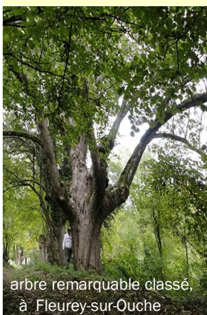
arbre remarquable classé, à Fleurey-sur-Ouche

Dans certaines forêts domaniales, dans certaines communes, il existe des arbres dits "remarquables" : ils sont classés ou protégés.