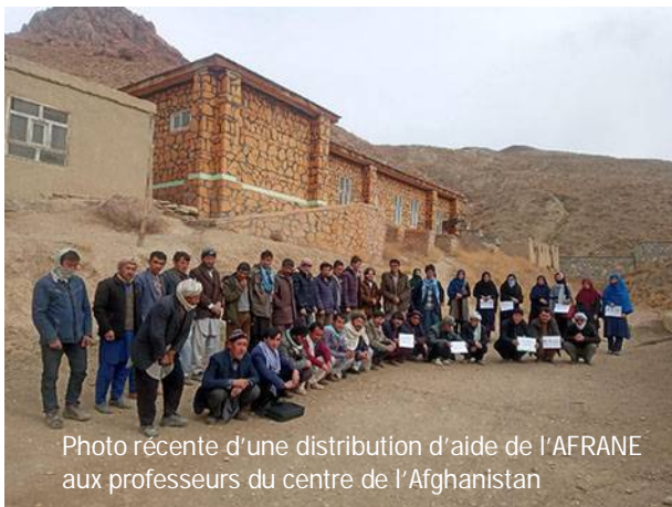
Photo récente d'une distribution d'aide de l'AFRANE aux professeurs du centre de l'Afghanistan